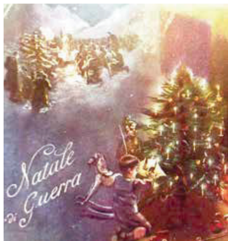
1° di copertina: Particolare di una cartolina di Natale scritta e viaggiata nel dicembre 1916 della Grande Guerra.

Gli articoli e le opinioni riportate all'interno del notiziario impegnano esclusivamente gli autori.